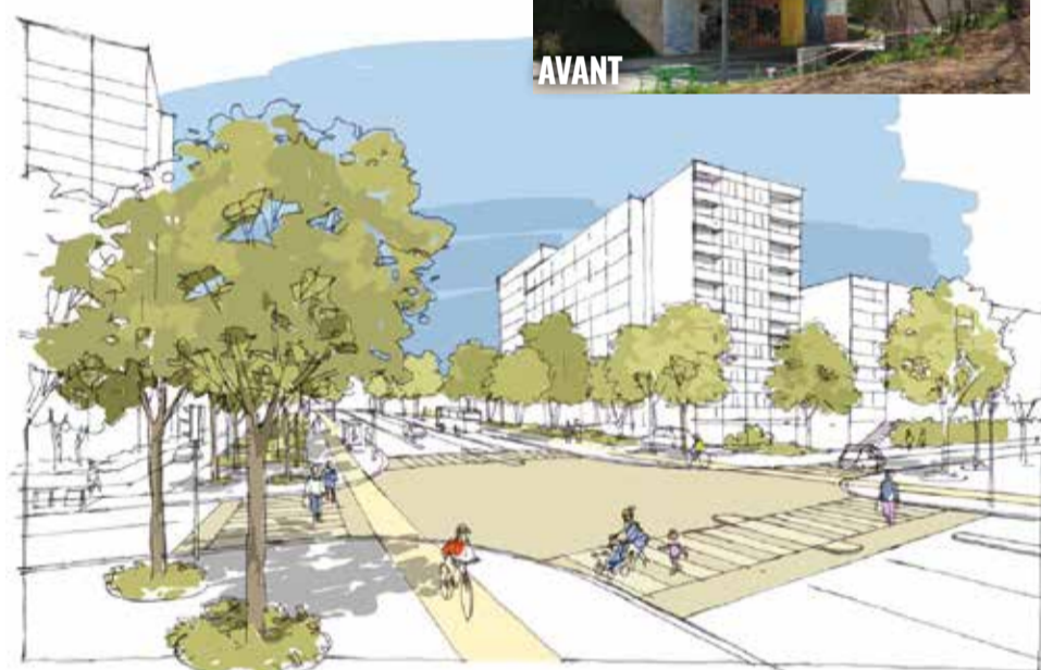
Le nouveau croisement avec feux de circulation - avenue du Lac / boulevard Kir