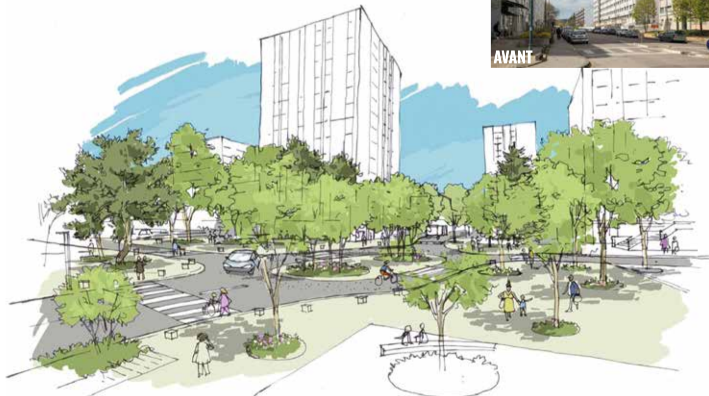
La placette avenue du Lac / avenue des Champs de Perdrix