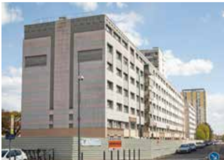
Immeubles Habellis en cours de démolition

Cinquante ans après la création du quartier, les bailleurs sociaux réhabilitent peu à peu leur parc immobilier pour améliorer la qualité de vie des habitants et le confort thermique des bâtiments. Les travaux de l'îlot Corse s'achèvent, ceux de l'îlot Île-de-France débuteront cette année. Les îlots Franche-Comté, Gascogne et Berry suivront l'année prochaine. Les deux immeubles HLM de 1971, situés 32-42 avenue du Lac, sont démolis pour donner une nouvelle respiration à l'avenue. Les travaux ont démarré et s'achèveront en décembre 2021.