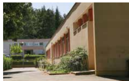
École maternelle Buffon