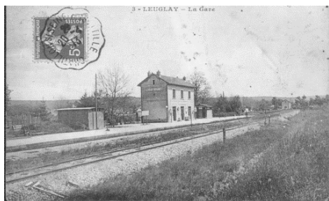
« Carte postale de la Gare dans les années 20 »

Restauration de la gare, de la halle de marchandises et de l'annexe, typiques des petites gares du XIXe siècle, dans le cadre d'un ambitieux projet d'hébergements touristiques.